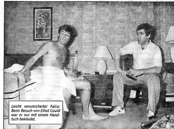
Leicht verunsicherter Falco: Beim Besuch von Elliot Gould war er nur mit einem Handtuch bekleidet.

Zwischendurch freilich geht sich noch ein Besuch in New Yorks berühmten Discoteken „Studio 54“