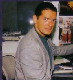
Zu Besuch im R-E: Falco spielt sein neues Album „Nachtflug“ vor, das im Herbst erscheinen wird.

R-E: Auf dem neuen Album „Nachtflug“ (der R-E berichtete ausführlich, Heft 5/92) gibt es keine leeren, nichtssagenden Texte wie auf „Data de Groove“ mehr. Ist Hans Hölzel wieder so frech und