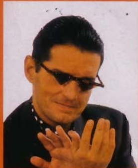
Einzelstück: Mit dreieckigen Gläsern.