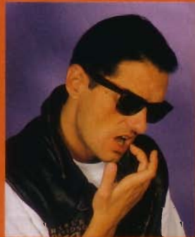
Klassisch: Die coole Ray Ban.