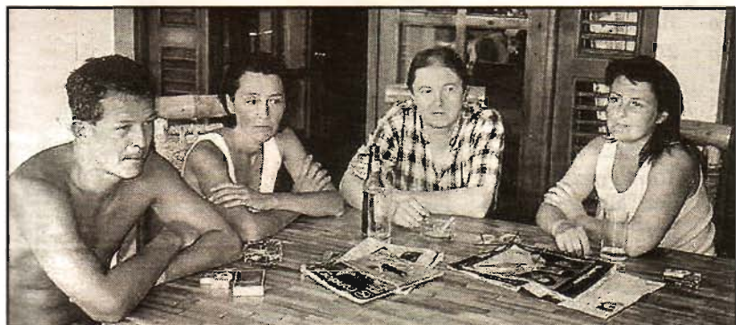
Seine Freunde in Puerto Plata kannten Falco als den netten „Hansi“